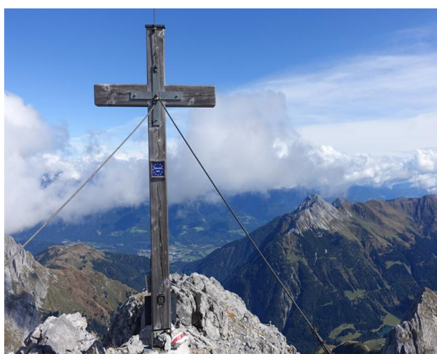
Cima del Polinik